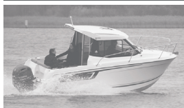
Merry Fisher 605