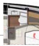
Model available with walk-in closet or bathroom