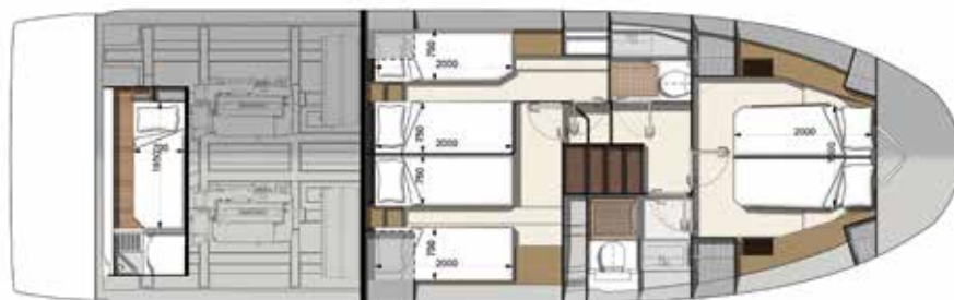
Model available with 2 or 3 staterooms