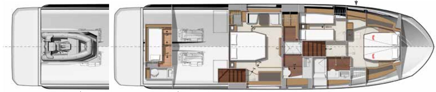
Model available with tender garage or skipper cabin