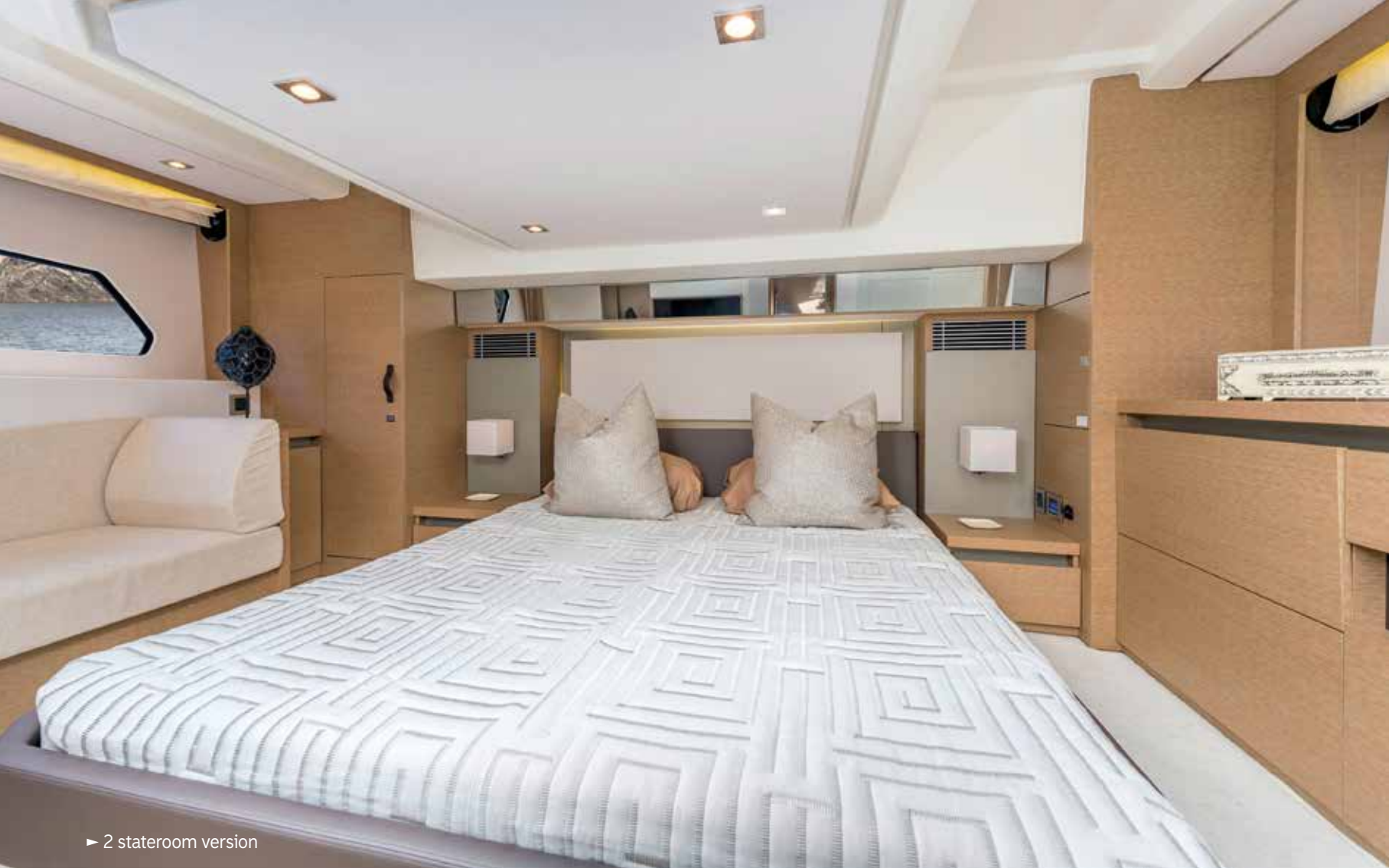
► 2 stateroom version